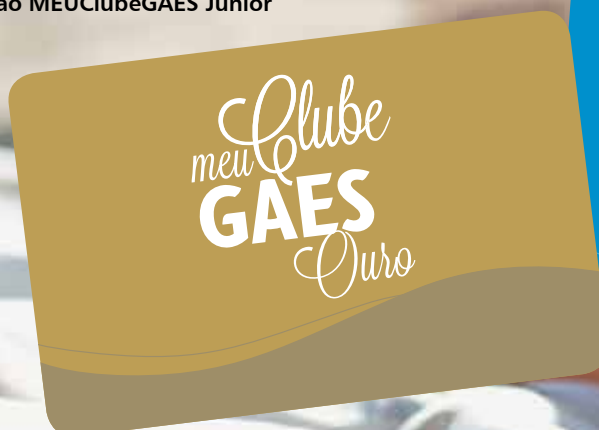
Cartão MEUClubeGAES Ouro