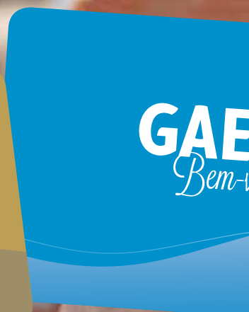
Cartão MEUClubeGAES Bem-vindo