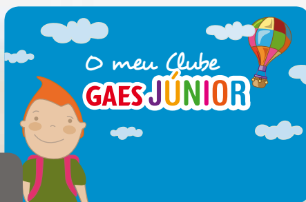
Cartão MEUClubeGAES Júnior