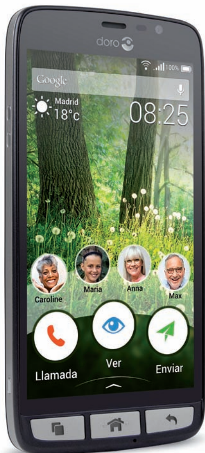
DORO Liberto® 825.